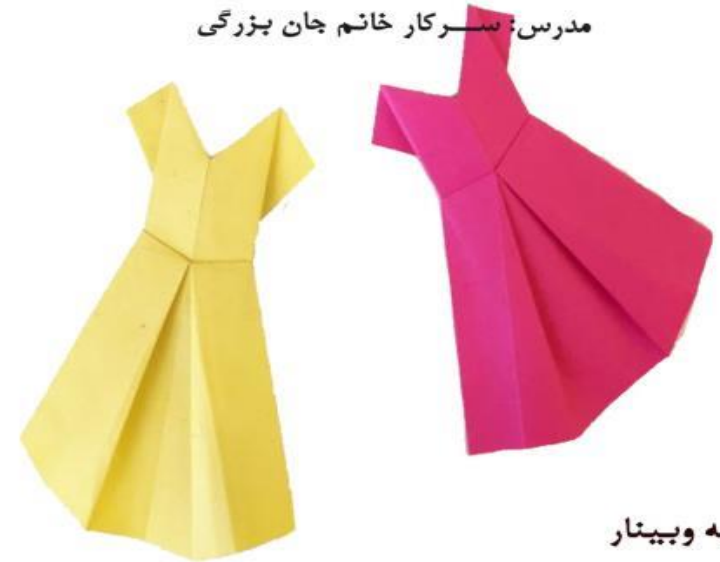
ورودیه و بینار

سمیاد بخش همایش ها ووبینارهای استان البرز -اوربگامی بافت در طراحی لباس